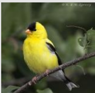
Chardonneret jaune