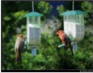
Mangeoires à Cardinal