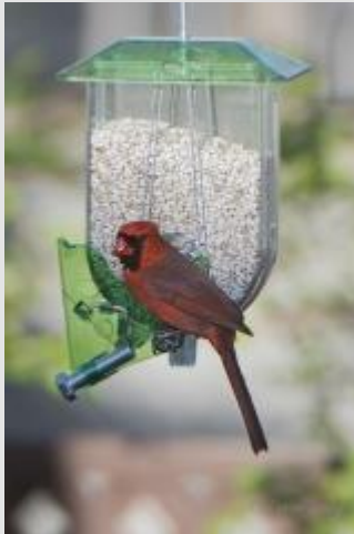
Mangeoire à cardinal