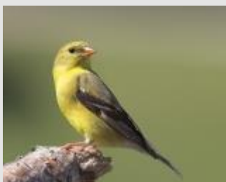
Chardonneret jaune

L'été dernier (2012) a été très chaud et sec, ce qui a entraîné une diminution de graines naturelles disponible pour le chardonneret favorisant la présence de ce dernier aux mangeoires. Les températures plus fraîches de cette année (2013) et des précipitations plus élevées ont permis une augmentation de la production de semences naturelles. C'est donc le buffet naturel à volonté pour les chardonnerets. Un autre facteur à considérer est l'augmentation progressive de zones urbaines où l'utilisation de pesticides est maintenant interdite. L'épanouissement résultant des pissenlits offre encore une fois une autre source de nourriture pour les chardonnerets lorsque leurs fleurs produisent des graines. Il est très probable que ces oiseaux profitent donc du résultat de ces conditions favorables et passent plus de temps à se nourrir dans les milieux naturels. Raison de plus pour sortir et faire nos observations sur le terrain!