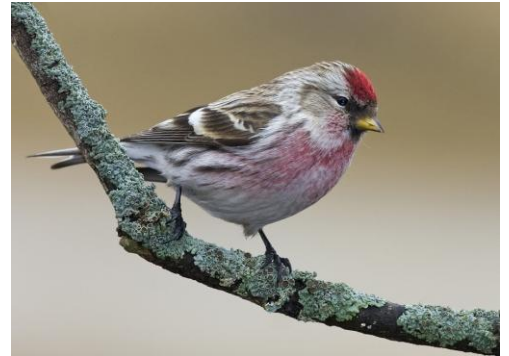
Sizerin flammé

reproduction avec 2 et même 3 couvées dans le nord du Québec. Ils devraient être communs dans le sud du Québec cette année. Aux mangeoires, ils préfèrent le chardon et le tournesol noir.