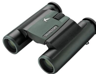
Swarovski CL Companion 8X25 –Poids 345g

Les écarts de température peuvent être extrêmes lorsqu'on arrive dans un pays chaud, sans oublier un degré d'humidité très élevé. Rien n'est plus décevant que de rater les plus belles observations à cause de jumelles remplies de buée. L' étanchéité de vos jumelles sera primordiale également dans les pays désertiques où le sable très fin peut s'infiltrer partout dans le