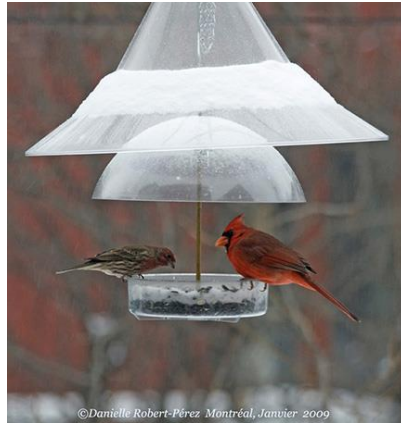
Montréal, Janvier 2009

Le dôme mandarin permet d'insérer une bonne partie de votre mangeoire à l'abri des intempéries. Il est aussi conçu pour basculer sous le poids d'un écureuil qui voudrait accéder à la nourriture par le haut. Une option très utile en toutes saisons. Il est important de noter que ce ne sont pas tous les dômes qui sont anti-écureuils mais que celui-ci est très efficace contre les écureuils.