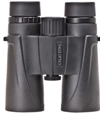
Eagle Optics Shrike 8X42

mécanisme (joints, œillets, molette, etc.). Si vous consacrez votre voyage principalement à l'observation d'oiseaux, il serait prudent d'avoir une deuxième paire de jumelles de rechange en cas de bris de vos jumelles principales pendant votre séjour.