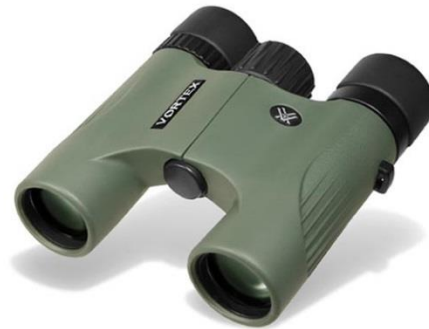
Vortex Viper 8X28 - Poids 335 g